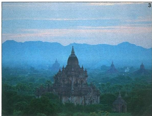
1/這艘全長六十一米，深一點四米的The Strand Cruise，是一艘超級豪華郵輪。2/郵輪上每間客房均擁有露台，可讓客人隨時隨地無阻隔欣賞到船外美景。3/萬塔之城蒲甘，是The Strand Cruise每次航程必經的知名景點。

郵輪旅程將分為北行和南行，期間途經經典的烏本橋、古老的曼德勒實皆山佛寺，還有坐擁壯麗景致的蒲甘萬廟。郵輪將提供十間豪華客艙、十三間Strand客艙、兩間特等套房及兩間Strand套房，每間客艙均配置落地玻璃窗、戶外露台、獨立浴室、免費無線網絡、國際電視頻道，同時又以緬甸工藝、柚木地板及當地原創藝術品點綴客房空間，更貼心提供二十四小時管家服務。公共空間則擁有偌大泳池、水療中心、足療站、健身中心、連恆溫酒窖的品酒區，以及可飽覽河川美景的單點餐廳。船上還設有多項特備節目，包括於上層甲板享用燒烤晚餐及露天下午茶體驗等。郵輪服務團隊由五十六人組成，他們均樂意為住客設計不同的日間岸上遊覽活動。