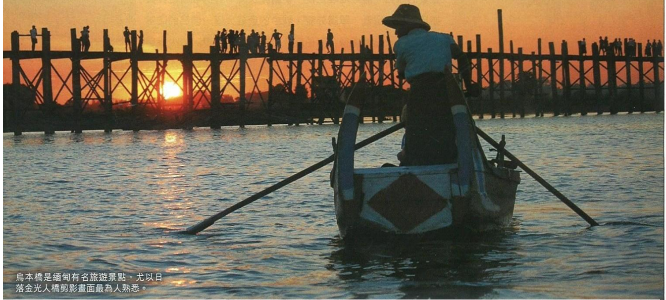
烏本橋是緬甸有名旅遊景點，尤以日落金光人橋剪影畫面最為人熟悉。

仰光著名酒店The Strand Hotel，最近宣布推出全新豪華郵輪The Strand Cruise，雖然現階段仍在緬甸建造中，但已決定於明年一月初開始遊走有「象河」之稱的伊洛瓦底江，展開來往蒲甘及曼德勒的三晚和四晚航遊之旅。